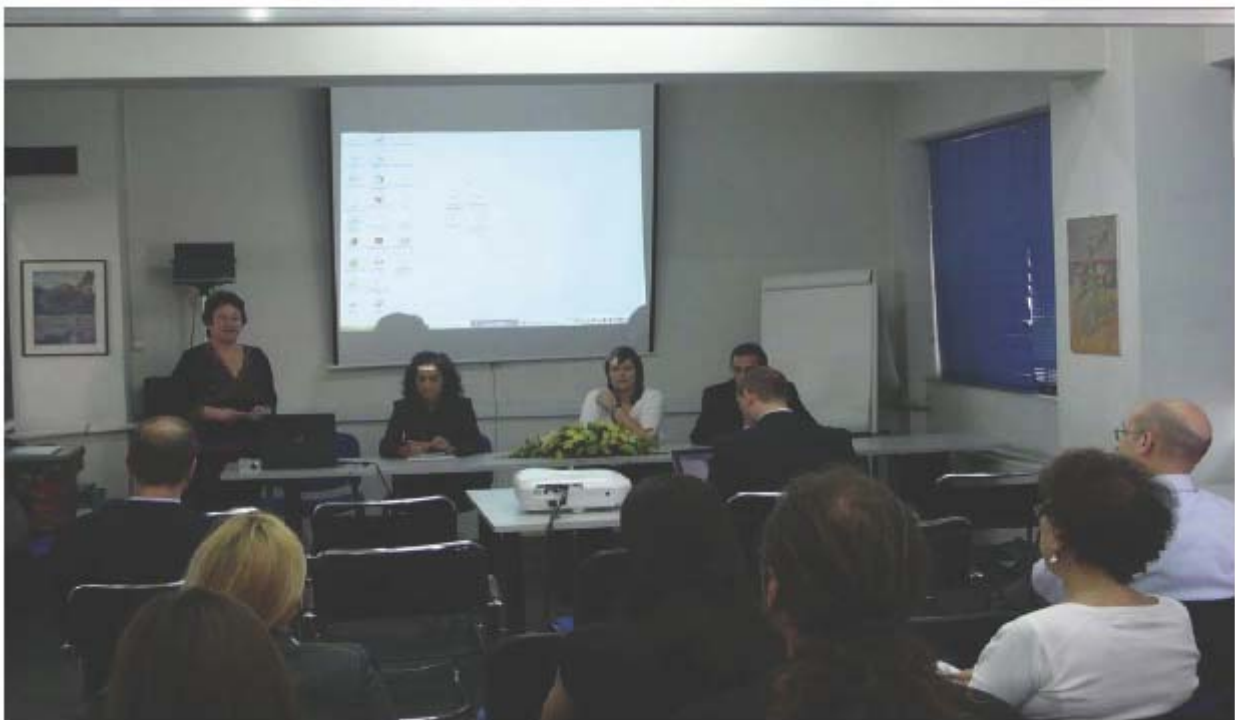
Seminar in Pireo