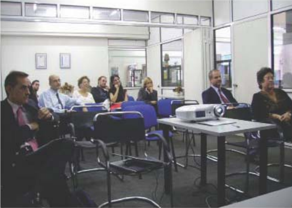
Seminar in Pireo

Depois do Seminário de Praga de 05-06/06/2008 teve lugar um segundo seminário enquadrado no projecto e que foi realizado nos Pirinéus em 23-24/10/2008.